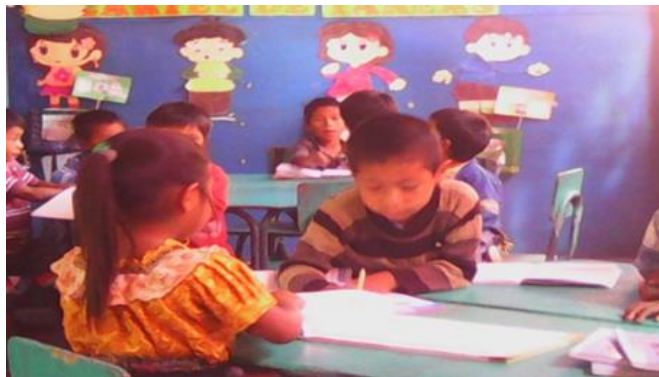
Fuente: Niños de la primaria de Santa Cruz de Quiche.