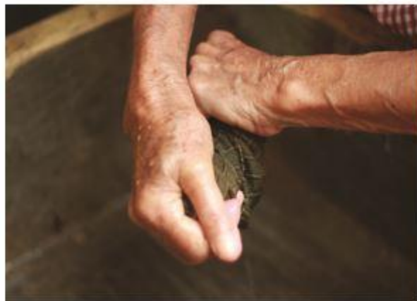
Sus labores son limpiar, lavar trastos, cocinar, entre otros.