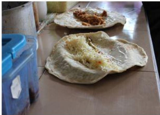
Los tunos se conocen en el Municipio de Amatitlán, por ser una tortilla de carne o pollo con queso y repollo.