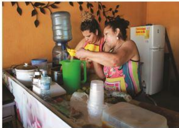
Su sobrina la ayuda en el comedor a llevar pedidos y cocinar