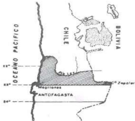
(MINEX Bolivia; 2004:16)

A consecuencia de esta guerra, Bolivia perdió 120,000 Km 2 , de 400 kilómetros de costa, varios puertos, bahías y caletas, así como su acceso soberano al Océano Pacífico. (MINEX Bolivia; 2004).