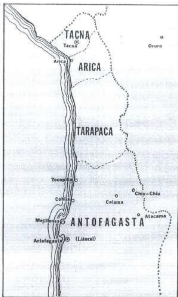
(MINEX Bolivia; 2004:18)

La ilustración que antecede tomada del Libro Azul, muestra el área afectada y tomada por Chile a consecuencia de la guerra del pacífico en 1879.