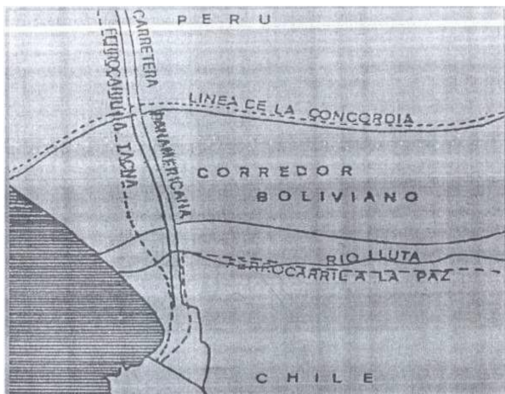
(MINEX Bolivia; 2004:17)

Posteriormente, Chile consultó acerca de la propuesta al Perú en función de lo estipulado en el Tratado de 1929, esto hizo retroceder cualquier perspectiva percibida como acuerdo posible, argumentando por su parte la opción de un espacio geográfico trinacional. Consecutivamente los tres países sostenían sus posturas respectivas, pese al Acuerdo de Charaña el cual representaba la propuesta de solución a la problemática, las negociaciones fracasaron como consecuencias Bolivia y Chile volvieron a romper relaciones diplomáticas en marzo de 1978 (Plorutti; 2011:40).