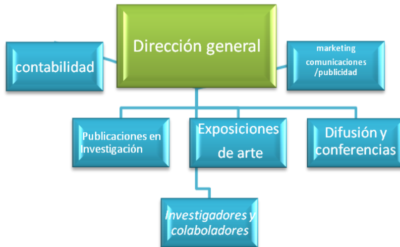
Tabla No. 1 Posible organigrama de la Asociación Civil