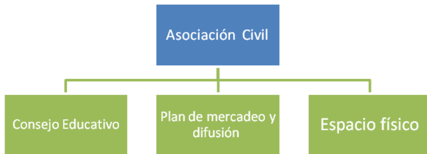
Tabla No. 9