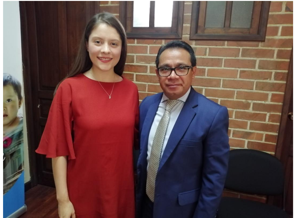
Con Dorian Delfino Taracena Presidente de la Comisión de la Mujer, Congreso de la República de Guatemala, 2019