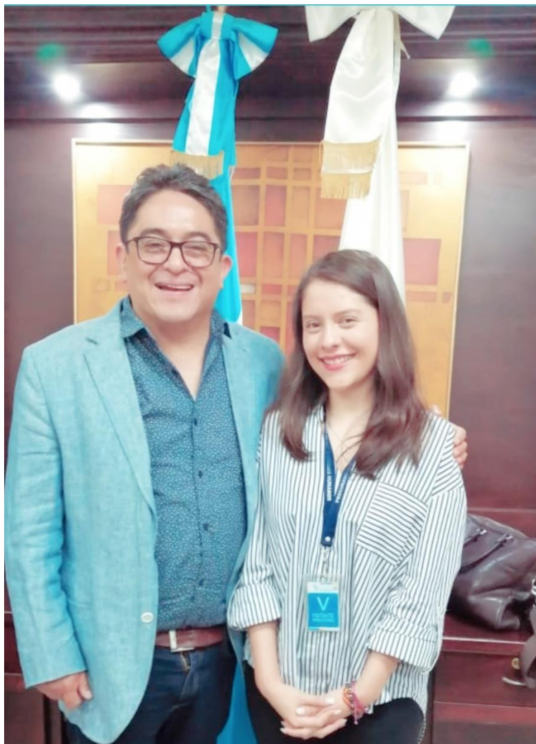
Entrevista con Jordán Rodas, Procuraduría de los Derechos Humanos de Guatemala, 2019