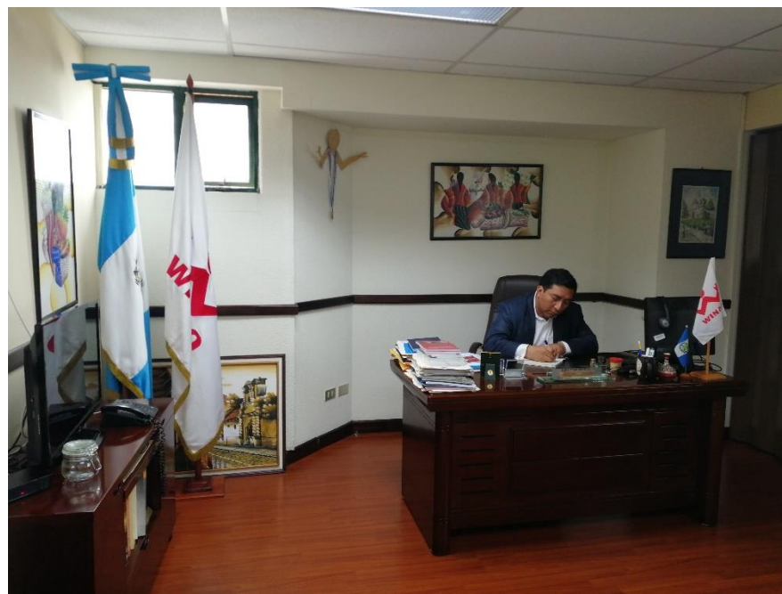
Entrevista con Amílcar Pop, Congresista por WINAQ 2015-2019, Despacho, Congreso de la Republica