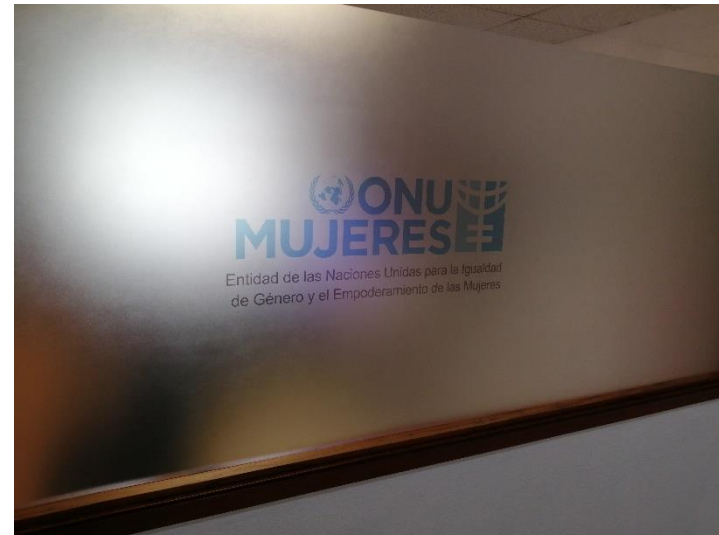
Fotografías de Oficinas de ONU Mujeres en Ciudad de Guatemala, 13 Calle 8-44, Cdad. de Guatemala