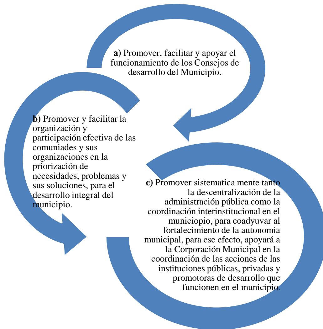
Figura 4. Criterios de la Ley de Concejos