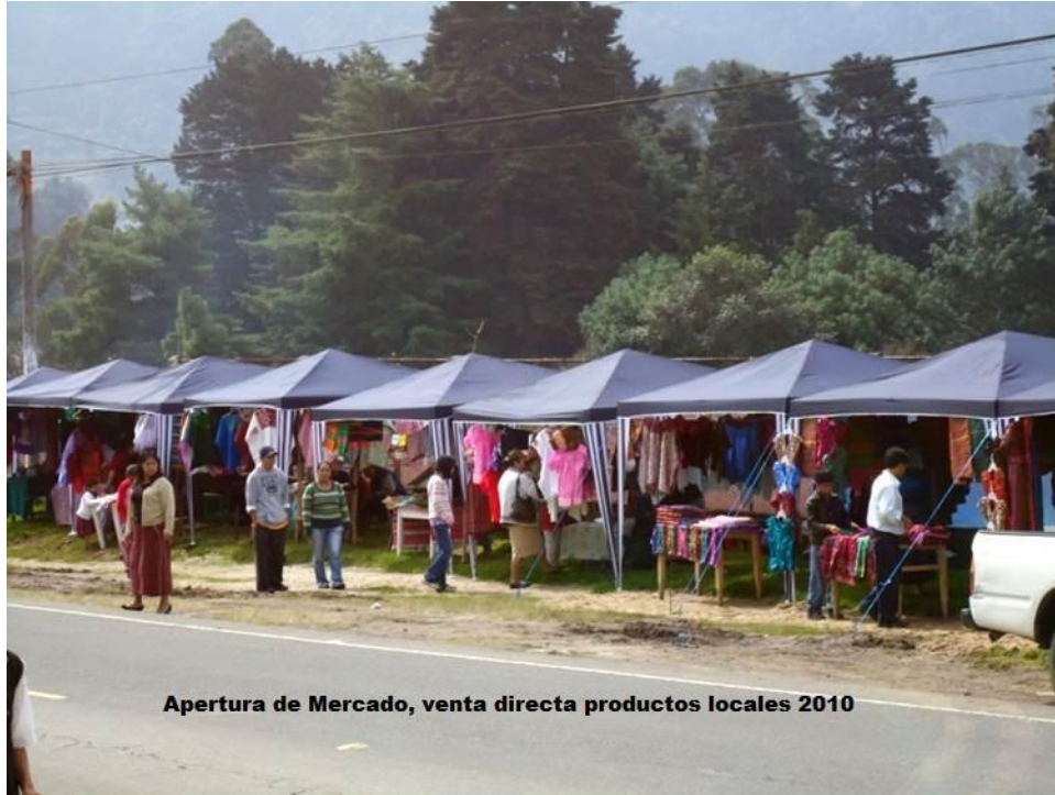
Apertura de Mercado, venta directa productos locales 2010