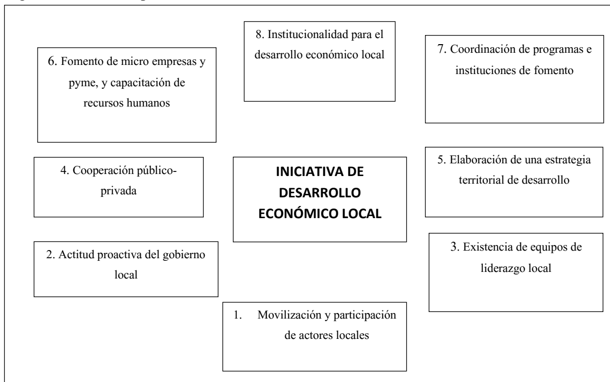
Figura 1. Elementos para las iniciativas de desarrollo económico local.