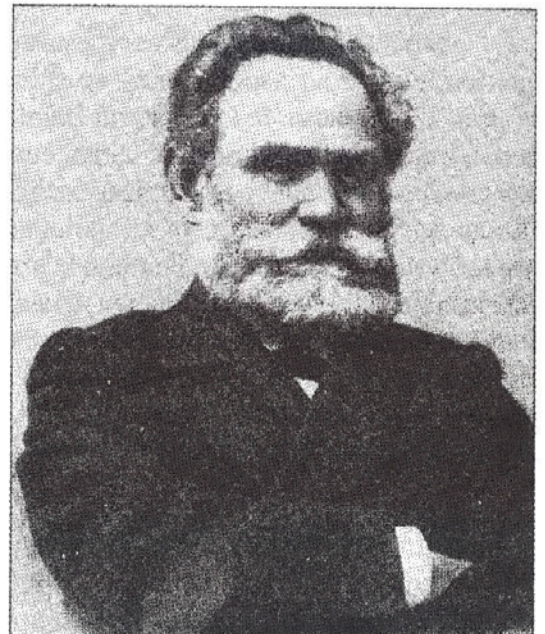
IVÁN PETROVICH PAVLOV (1849-1936).

Iván Petrovich Pavlov. El sistema más general de la reflexología rusa se debe a Iván Petrovich Pavlov (1849-1936), cuya larga y productiva carrera nunca sufrió grandes interrupciones, a pesar de las agitaciones de la Revolución rusa. Pavlov nació en una pequeña población del centro de Rusia, hijo de un sacerdote parroquial ortodoxo. Primero trató de seguir la vocación de su padre, pero cambió de opinión y en 1870 se