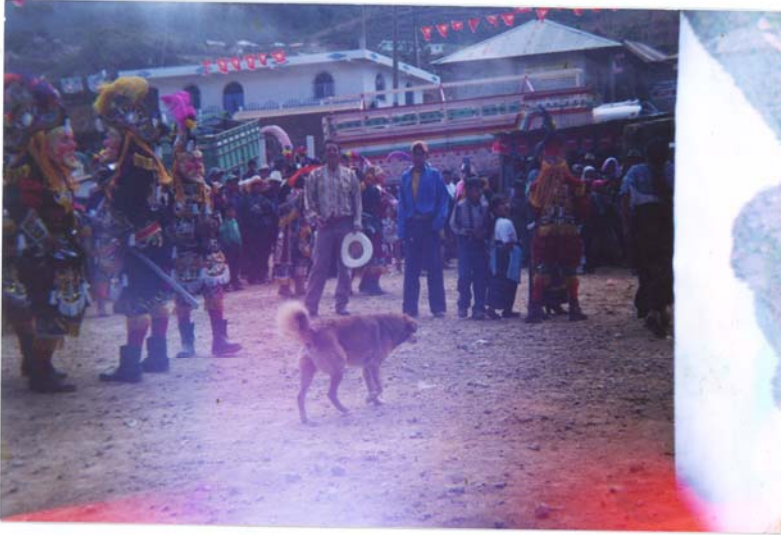
Baile: historia de la conquista de Guatemala