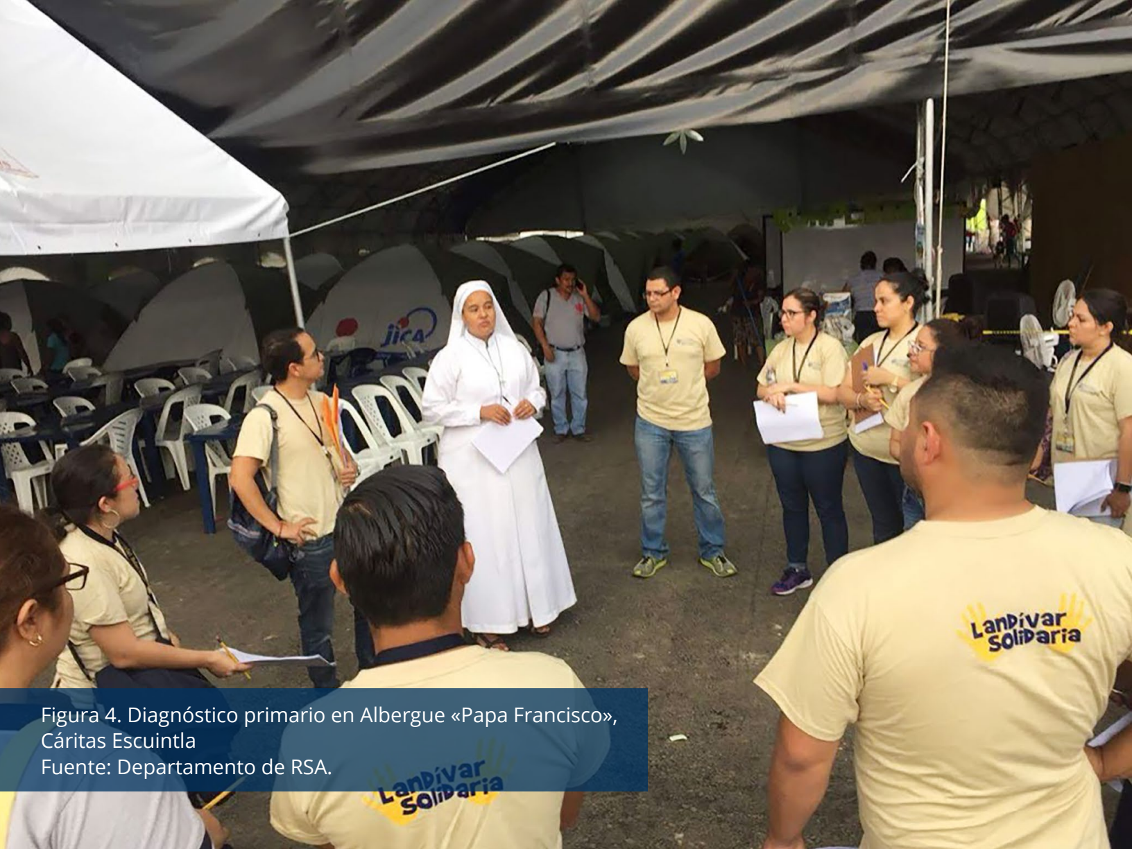
Figura 4. Diagnóstico primario en Albergue «Papa Francisco», Cáritas Escuintla