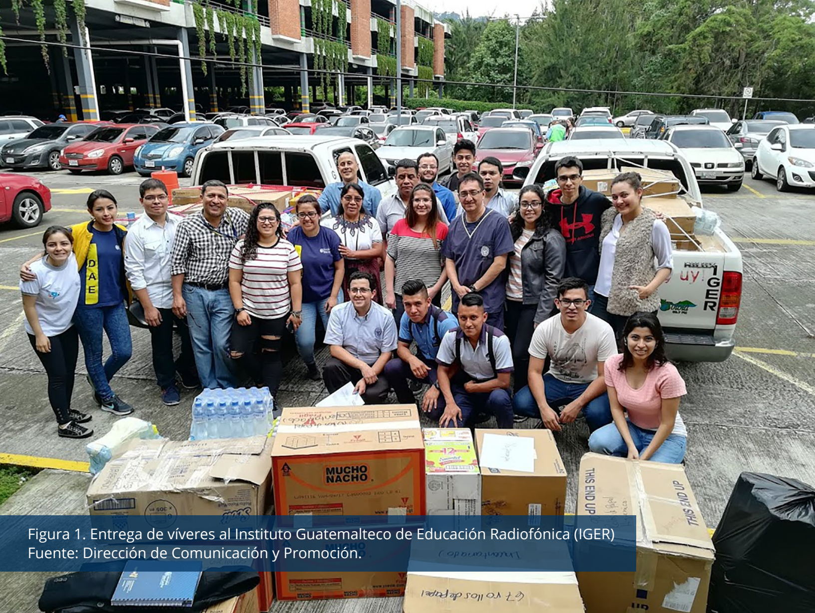
Figura 1. Entrega de víveres al Instituto Guatemalteco de Educación Radiofónica (IGER)

referencia a que todo centro jesuita de enseñanza superior está llamado a vivir dentro de una realidad social y a vivirla, iluminándola con la inteligencia universitaria, empleando todo el peso de la institución para transformarla. Lo distintivo de la labor de responsabilidad social de las universidades de la Compañía de Jesús es poner sus haberes y saberes al servicio de la sociedad. Es de esta manera que la Universidad Rafael Landívar, a través del Programa Landívar Solidaria, aportó a las comunidades afectadas por dicho desastre.