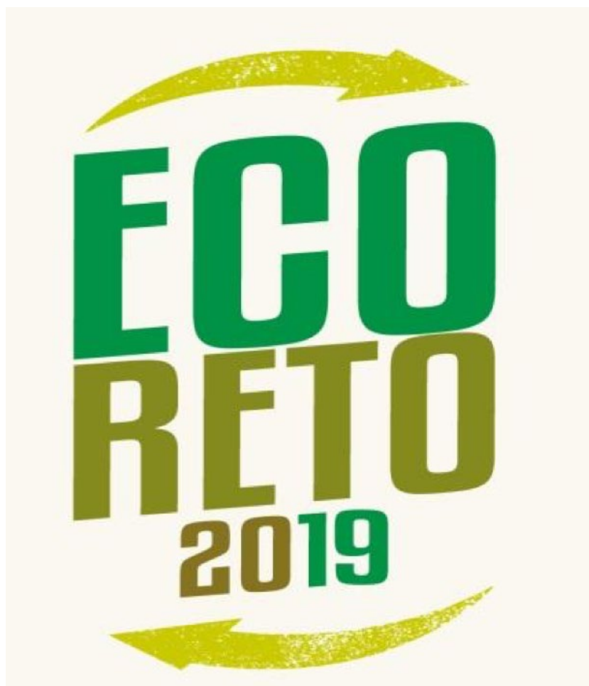
Figura 1. Logotipo Eco Reto

Este proyecto es una muestra del firme compromiso que tiene la institución de promover un modelo de gestión socioambiental que garantice mejores niveles de convivencia en la comunidad landivariana.