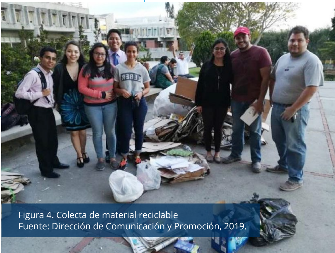
Figura 4. Colecta de material reciclable