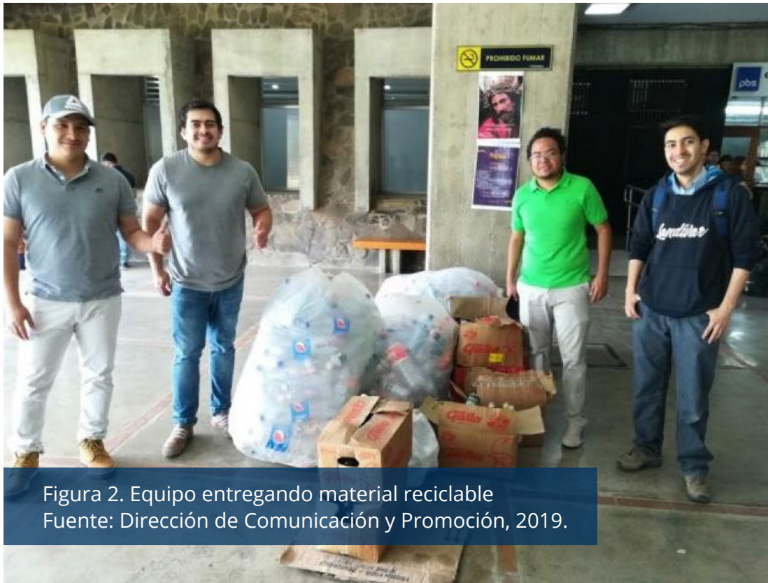
Figura 2. Equipo entregando material reciclable