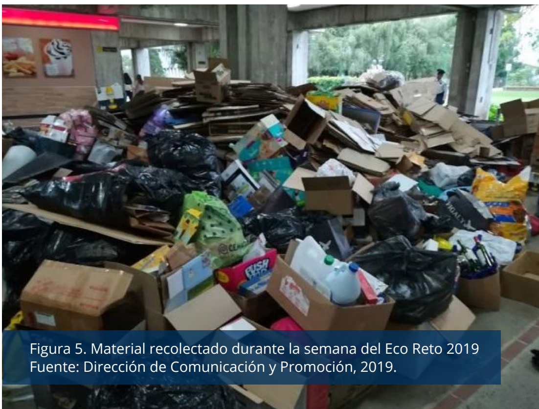
Figura 5. Material recolectado durante la semana del Eco Reto 2019