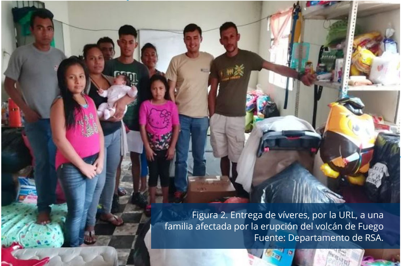
Figura 2. Entrega de víveres, por la URL, a una familia afectada por la erupción del volcán de Fuego.