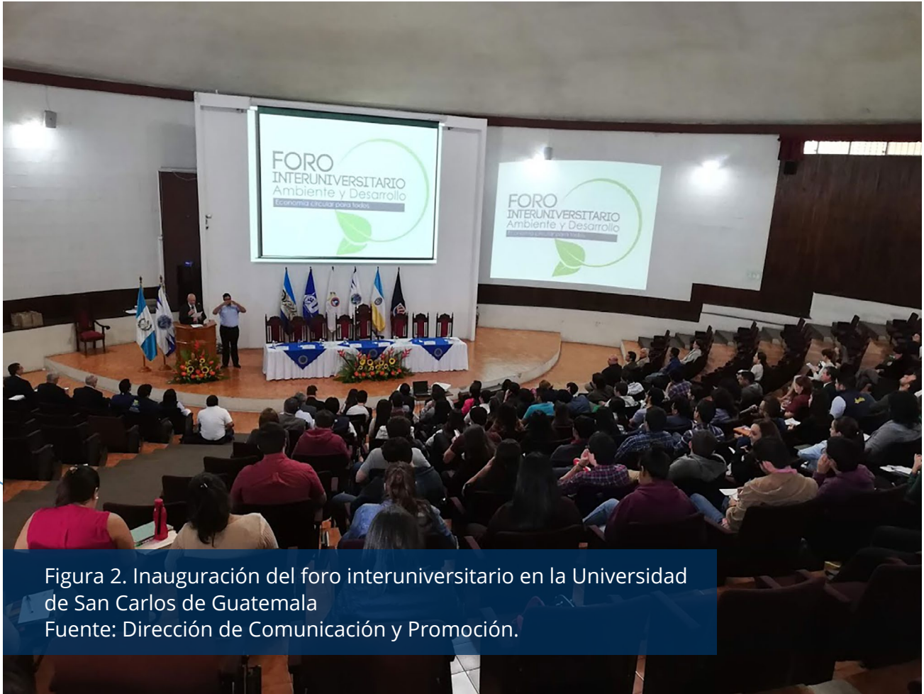
Figura 2. Inauguración del foro interuniversitario en la Universidad de San Carlos de Guatemala